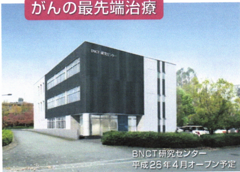
BNCT研究センター 平成26年4月オープン予定

H25年10月8日の府議会の一般質問でBNCT(※)について質問を行い、大阪でこのがん治療が受けられるとともに、臨床の場と研究開発が一体化した拠点を設備されるよう取り組んでいくとの答弁がありました。