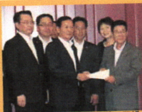
公明党府議団で知事に要望

平成23年度から27年度までの予定で実施している私立高校の授業料無償化制度で、在学中に期限を迎える26、27年度入学者は卒業まで無償化が適用されることになりました。