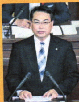
代表質問する八重樫府議