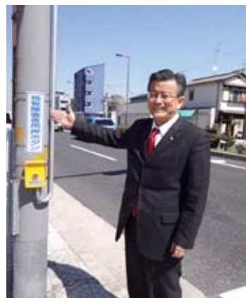
西成・橘の信号で 音が出るようになりました。