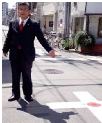
大正・千島1丁目 交差点の安全を進めました。