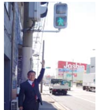
西成・南津守で信号機を 整備できました。