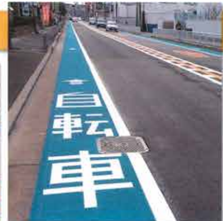
▲自転車レーン(寝屋川市内)