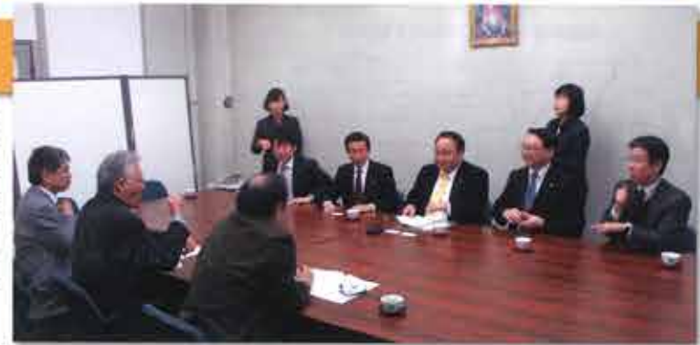
▲大阪聴覚障害者協会の代表らと意見交換

鳥取県や神奈川県、群馬県のほか、府内の市町村だと大阪市、大東市が手話言語条例を施行しています。公明党府議団は聴覚障がい者団体との意見交換を踏まえ、ほかの障がい種別の人たちや事業者、市町村などが幅広く参画して検討する場を速やかにつくるべきと求めました。府は市町村や学識経験者らによる「障がい者施策推進協議会」に新たな部会を設置し、平成29年4月の条例施行を目指す、と答弁しました。