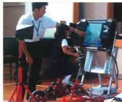
▲自転車の安全教育にシミュレーターを活用

成立した条例は対人事故の賠償額が高額化している実態を踏まえ、7月1日から府民に保険加入を義務付けます。府は自転車販売店での保険加入の確認、市町村から地元自治会への周知などわかりやすく情報を提供する、と答弁しました。