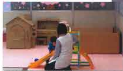
▲子ども一時預かり施設(OSAKAしごとフィールド)