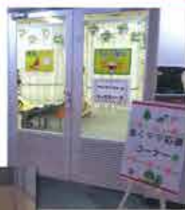
▲働くママ応援コーナー(OSAKAしごとフィールド)

府はOSAKAしごとフィールドを軸にドーンセンターや他の支援機関とネットワーク化し、就業や子育てなどの相談にワンストップで対応する体制をつくる、と答弁しました。