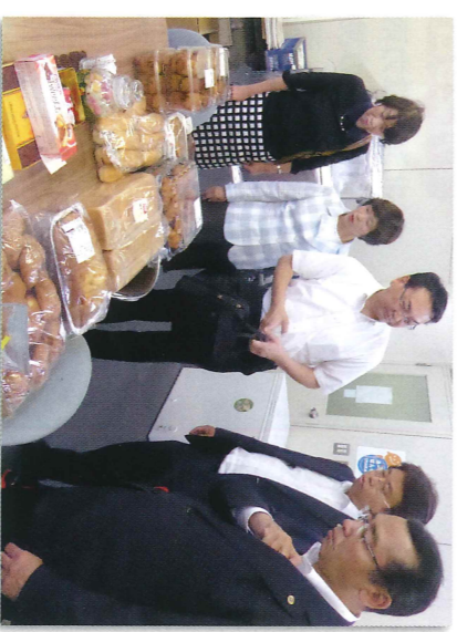
▲食品ロスゼロに取り組む団体を視察

4月に開かれた「G7新潟農業大臣会合」で食料の損失や廃棄が世界的な問題である、と指摘されたことや、公明党が国に「食品ロスゼロをめざして」と提言したことを通し、府も実行計画の作成や目標数値を設定すべき、と訴えました。府は食品廃棄物の削減の働きかけなどの普及啓発をはじめ、幅広い対応が必要だとして、全庁横断的なワーキングチームを設置すると答えました。