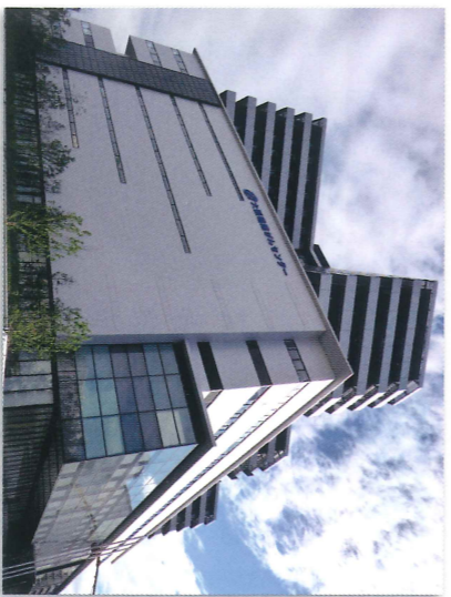
▲来春開院する大阪国際がんセンター

がん治療による脱毛や肌の変色など、外見の変化が患者の精神的な負担となっていると指摘。外見の変化を和らげ、患者をケアするアプリアランス支援センターを来春、移転開院する大阪国際がんセンターに設置してはどうかと提案しました。これに対し府は、府内64カ所のがん診療拠点病院に積極的な取り組みを働き掛ける考えを示しました。