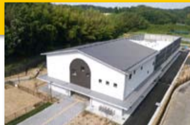
▲8月に開所したアニマルハーモニー大阪

「殺処分ゼロ」を目指し、8月に開所した府動物愛護管理センター、「アニマルハーモニー大阪」での犬や猫などの譲渡に向けた取り組みについてただしました。府は土日祝日も開所し、幅広い世代に来てもらえるようにしていることや、譲渡前の講習会、譲渡後の相談対応など一貫した支援をする、と答えました。