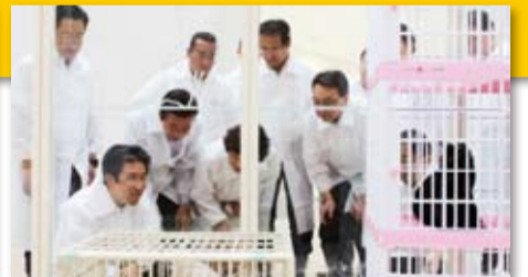
▲猫の室内飼育体験施設(アニマルハーモニー大阪内)